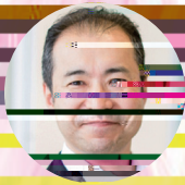
森重 丈二 株式会社